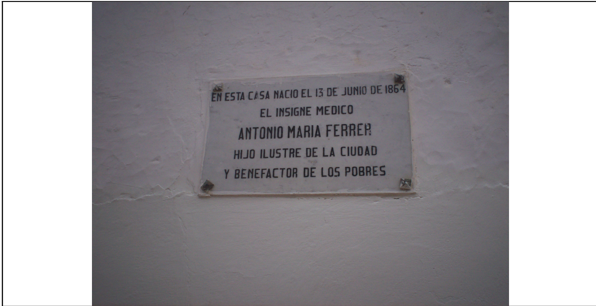
Placa en la casa de Santa Fe de Antioquia del médico Antonio María Ferrer.