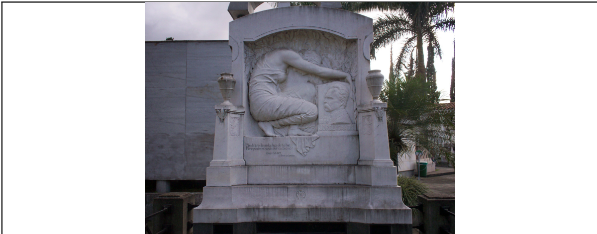
Monumento a Jorge Isaacs, en el Cementerio de San Pedro, en Medellín.