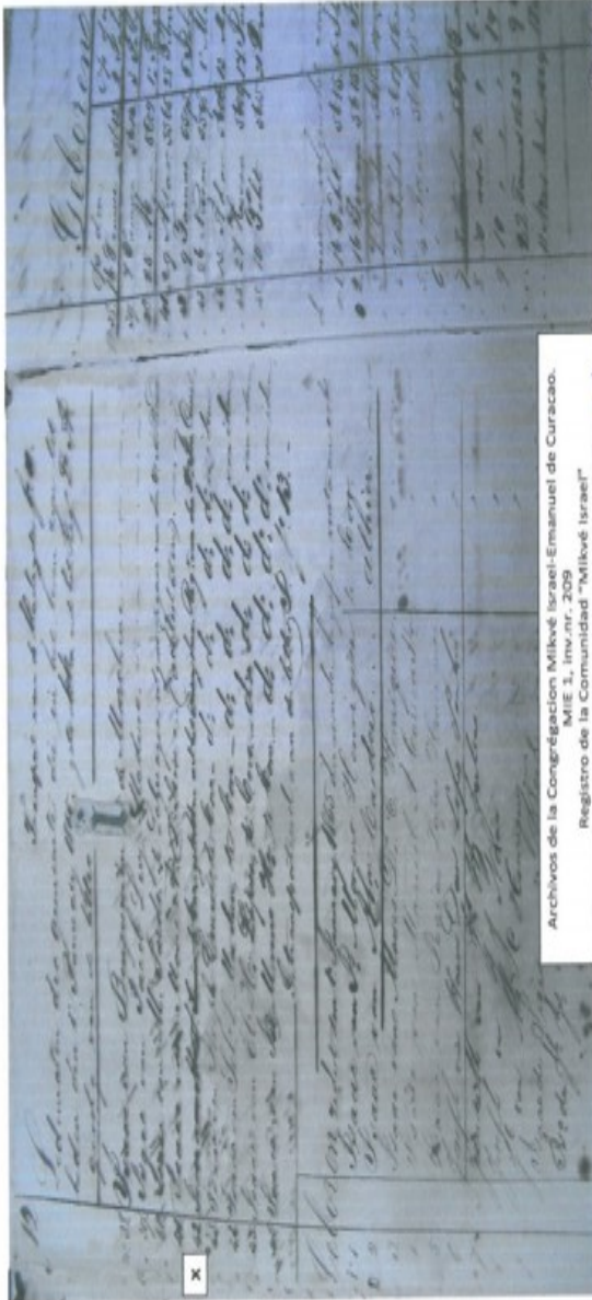
Archivos de la Congregación Mikvé Israel-Emanuel de Curaçao. MIE 1., Inv.nr. 209 Registro de la Comunidad "Mikvé Israel"